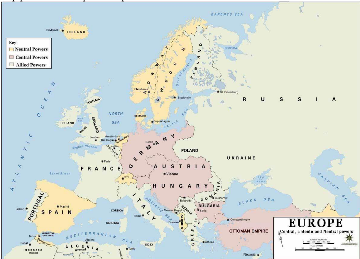
Европа през 1914 г.

От една страна, това са създадената въз основа на Франфуртския мирен договор Германска империя и кралство Италия, а от друга - старите демокрации Британия и Франция със своите колонии и доминиони. Най-често повтаряна тезата е за геополитическото и икономическото противопоставяне, за борбата за пазари, за интензивното германско и италианско стопанство, съперническо на колониалните метрополии Англия и Франция. Това обаче не обяснява разпада на т.н. Троен съюз и перфектното от правна страна излизане на Италия от него.