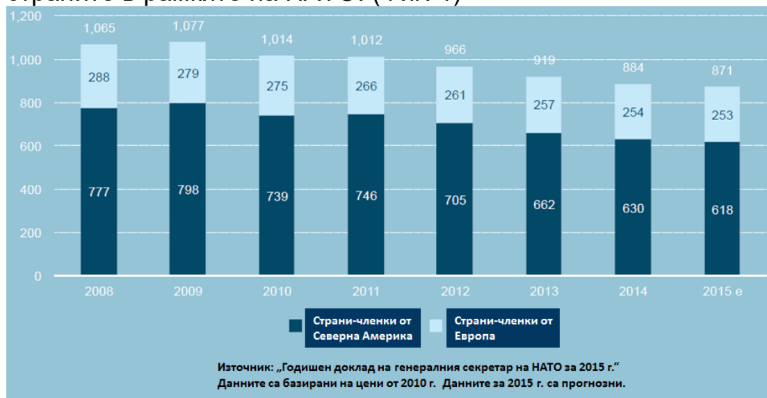
Фигура 1 – Разходи за отбрана на НАТО 2008 – 2015 в млрд. щ. д.

представа за нуждата от постигането на по-добър баланс на приноса на страните в рамките на НАТО. (Фиг. 1)