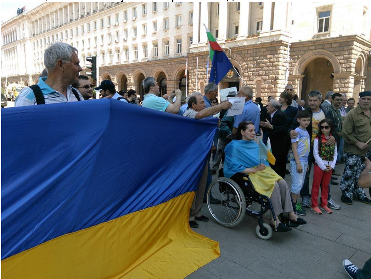
Украинската диаспора активно участва в митинга

Представителите на МВР и на жандармерията проявиха изключителна коректност към организаторите и участниците в митинга, за което получиха искрени аплодисменти.