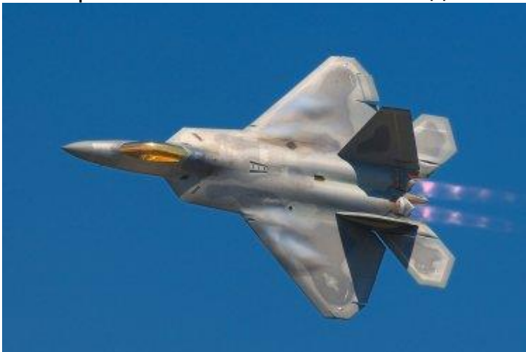
Изтребител пето поколение Ф-22 „Раптор“