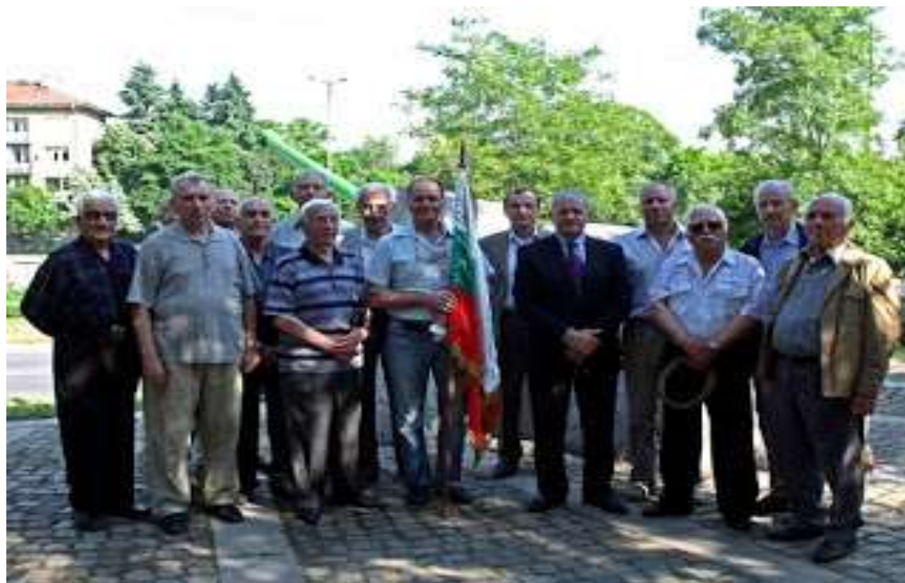
Танкови офицери от три поколения пред паметника на „Първа бронирана бригада“ – София 2015г.

Нека да помним думите на „бащата на американската литература“ Марк Твен, че след години ще се чувстваме разочаровани от нещата, които не сме направили, отколкото от нещата, които сме направили.