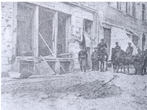
Снаряд нанася щети и на сградата на руската параходна агенция

Ужасените варненци се разбягват по улиците и търсят спасение в мазетата. Сред трясъка на експлозиите се разнасят писъци на отчаяние. Къщи рухват пред очите на обезумелите си обитатели. Чуват се викове и стенания на ранени, на които никой не е в състояние да помогне.