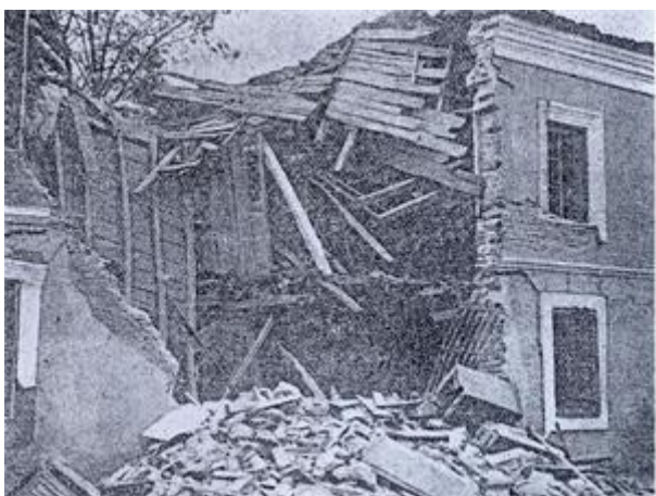
Къщи се срутват пред очите на обитателите си