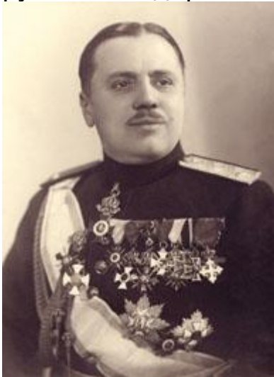
Генерал от артилерията Георги Попов

По случай 76-ата годишнина от присъединяването на Добруджа Министерството на отбраната, Съюзът на офицерите от резерва „Атлантик“, Съюз „Истина“ и наследниците на ген. Георги Попов организираха скромно тържество, на което бе открита паметна плоча, посветена на командващия Трета българска армия и генерал-управител на Добруджа генерала от артилерията Георги Попов. Пред сивата сграда на ул. „Солунска“ № 29 в София застанаха гвардейци и музиканти от Представителния духов оркестър на Българската армия, генерали и офицери от резерва и запаса, близки на генерал Попов, граждани и гости на столицата. Кавалерът на орден „За храброст“, депутат в 37-то и 38-то Народно събрание, почетният член на Съюз „Атлантик“ полк. о. з. Дянко Марков произнесе ярко слово. Генерал-лейтенант Георги Попов предвожда първите български войски, влезли в исконните предели на благодатна Добруджа. Той се справя блестящо и с длъжността генерал-управител на областта, като организира настаняването, оземляването и реинтегрирането на близо 68 000 българи, завърнали се от Северна Добруджа и от други райони на румънската държава.